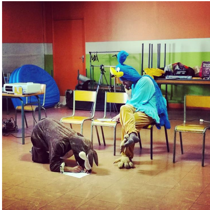
Bip Bip et Coyotte travaillent dur

Jour 3 : Installation dans le lieu et représentation