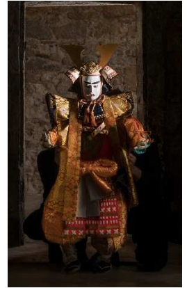
Bunraku, © Loiseau