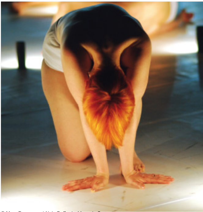
© Marc Dommage / Alain Buffard - Mauvais Genre