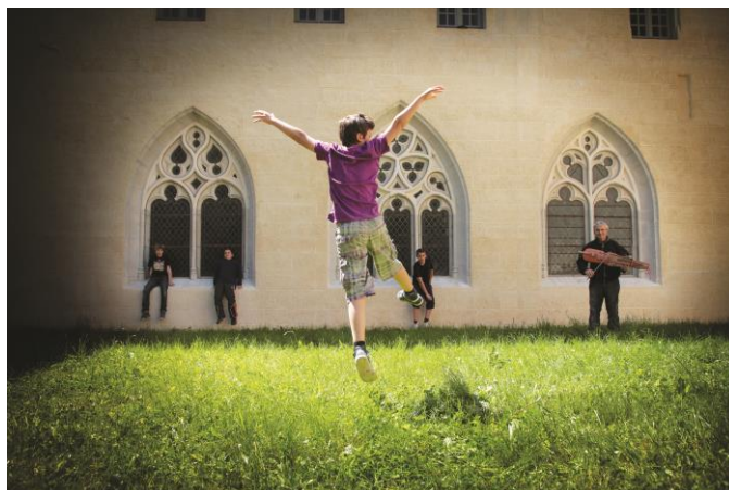
Abbaye d'Ambronay

« IMPROVISATION, PATRIMOINE ET CRÉATION »