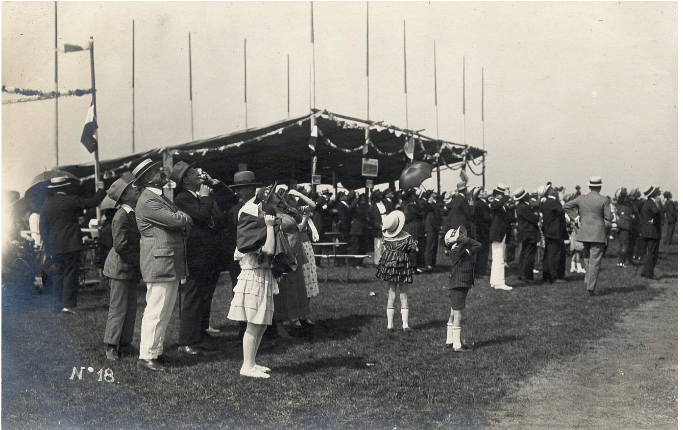
Le public au meeting aérien de Chalon-sur-Saône, 1922. 27J06