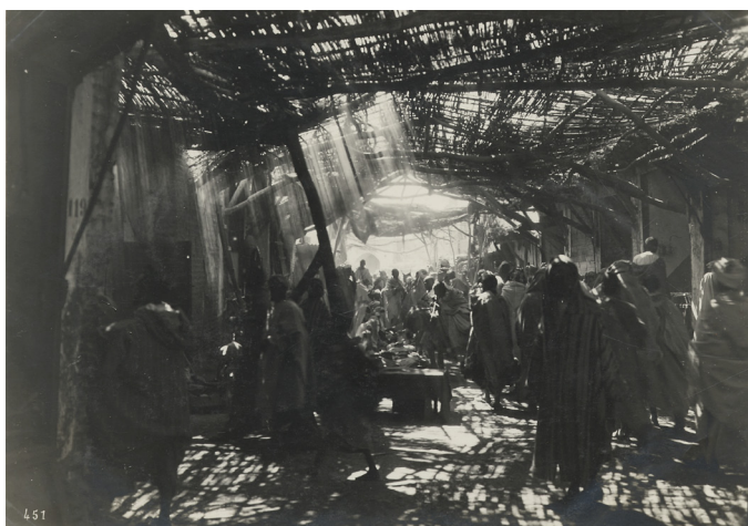
Les souks à Marrakech, 1929. 27J35