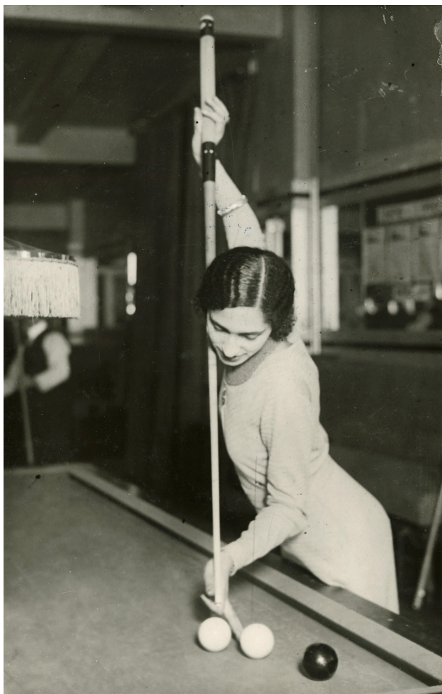
La princesse Yasmine d'Ouezzan, championne du monde de billard, vers 1933. 27J29