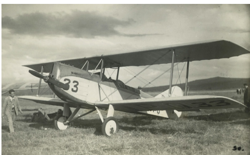
Le Caudron de Delmotte, au meeting d'aviation de Clermont-Ferrand, 1930. 27J15