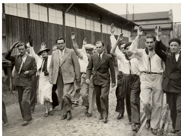
Jacques Doriot, fondateur du Parti populaire français, acclamé par la foule à Saint-Chamond, 1936. 27J32