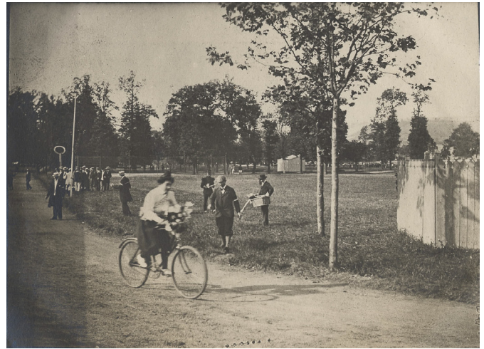
Une course de dames à l'Etivallière, 1902. 27J22