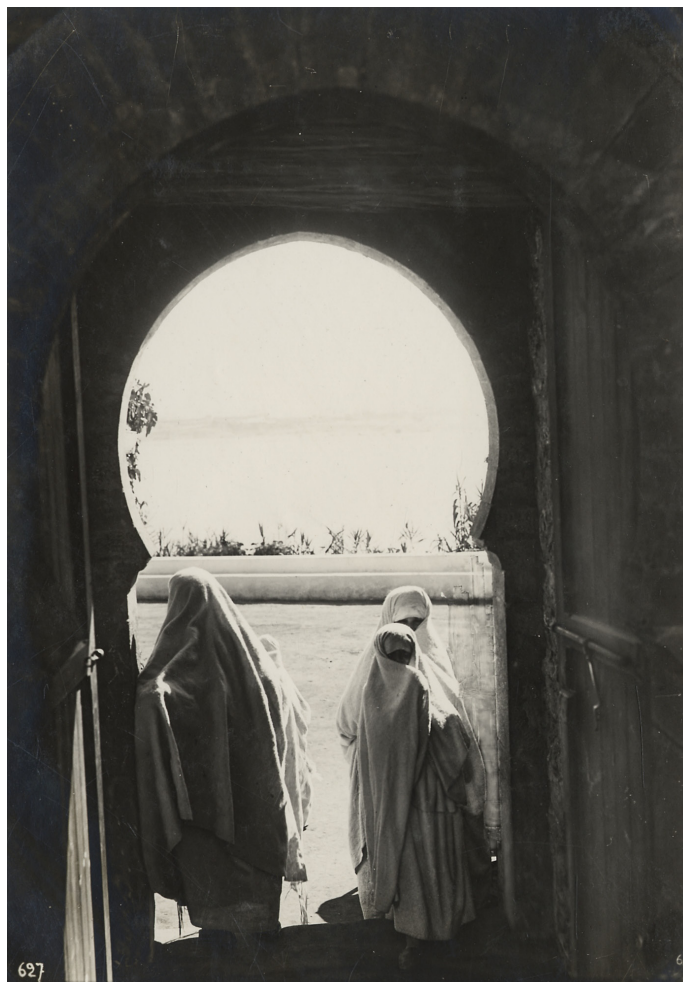
Des femmes au fort des Oudayas à Rabat, Maroc, en 1929. 27J35