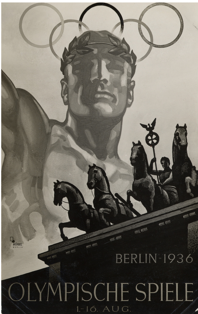
Une affiche officielle des Jeux olympiques de Berlin de 1936. 27J31