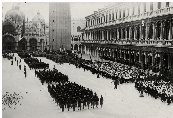
Un défilé fasciste à Venise, vers 1935-1936. 27J31