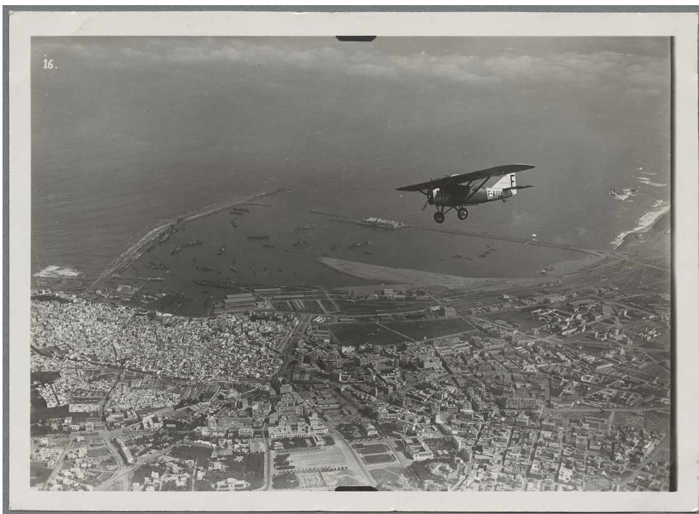
L'avion de la ligne Latécoère au-dessus de Casablanca, 1929. 27J35