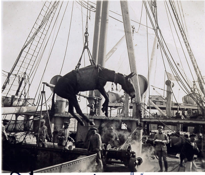
Débarquement des mulets

Le débarquement des mulets à Alexandrie, album de Marcel Saint-André, 1915. 27J03