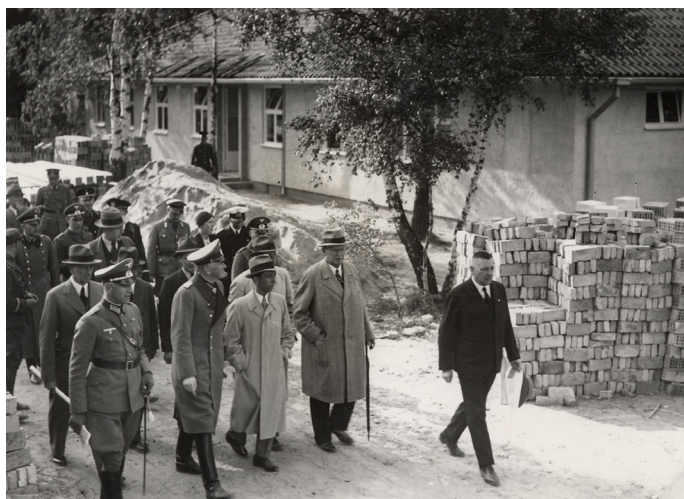
Le ministre de la Propagande, Joseph Goebbels, visite le chantier des Jeux olympiques de Berlin en 1936. 27J31