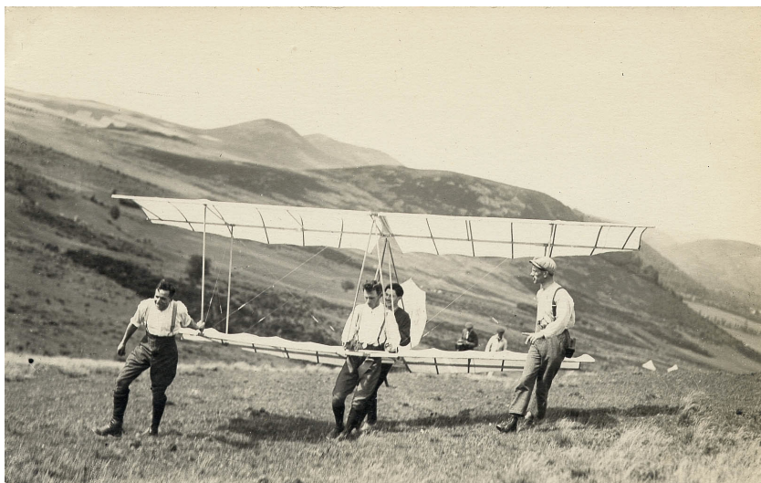
Le planeur Chardon est transporté à Combegrasse, 1922. 27J07