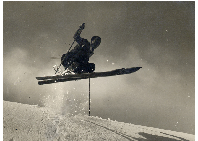
Skieur pris en contre-plongée, vers 1934-1935. 27J30