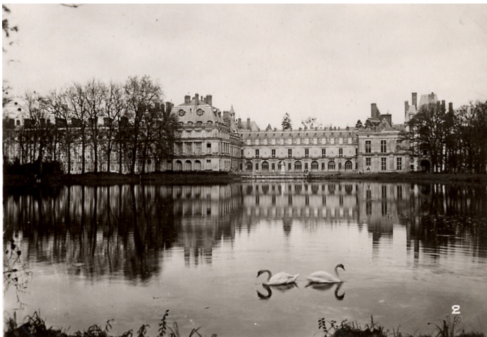
Vue du château de Fontainebleau en 1935. 27J30