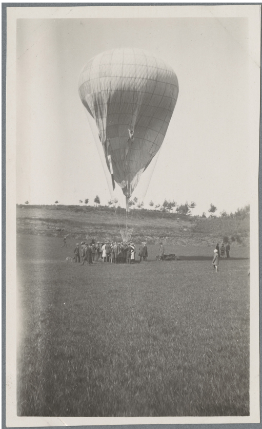
"Les aéronautes prisonniers", vers 1928-1929. 27J12