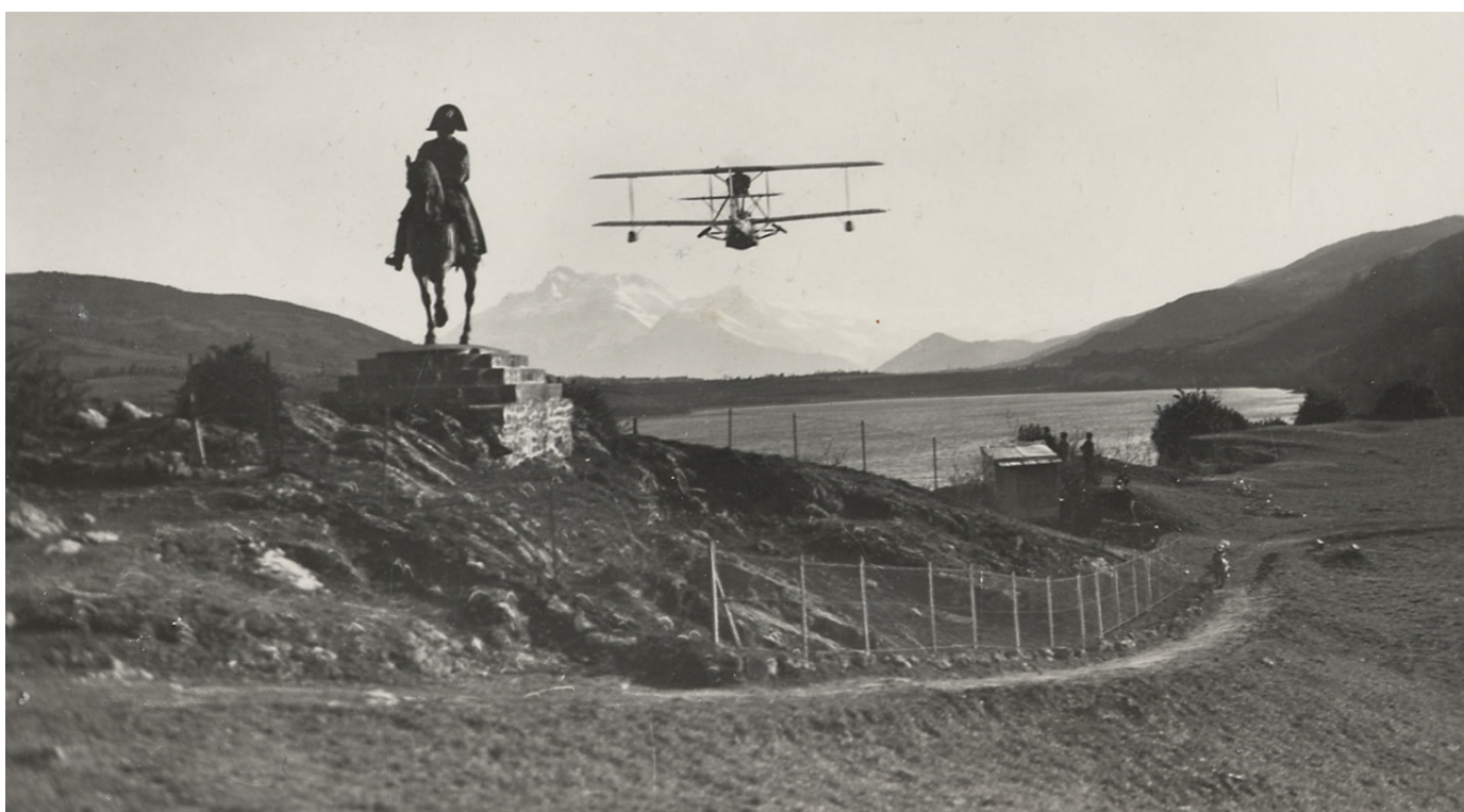
Vue du lac de Laffrey prise en 1932 lors de l'inauguration de la route Napoléon. 27J37