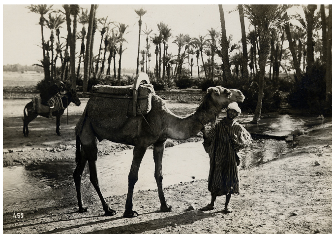
Dans la palmeraie, près de Marrakech, 1929. 27J35