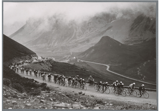
Les coureurs du Tour de France à l'assaut du Gallibier, 1939. 27J33