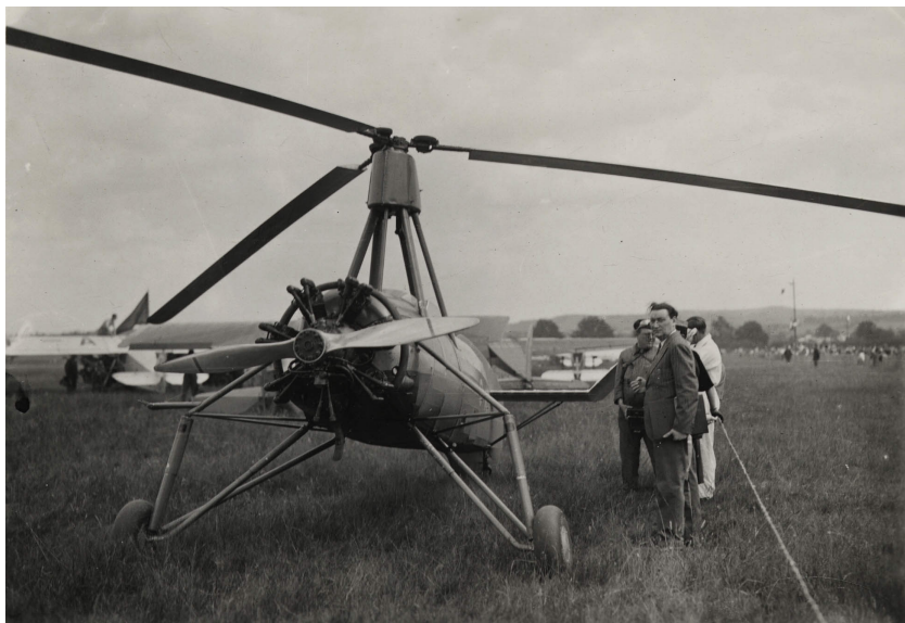
L'autogire, 1935. 27J16